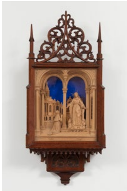
Mariananbetung, 1865, SZ 01909.

Wallfahrtsandenken, Metall, unbekannter Hersteller, 1. Hälfte 20. Jh., Geschenk (SZ 01931.9).