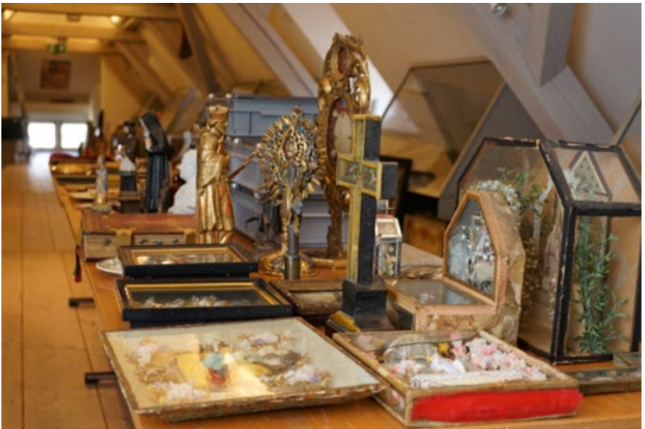
Oben: Museum Klösterli im Schloss Wyher, Ettswil vor dem Umzug; unten: Objekte der Sammlung Zihlmann werden inventarisiert.