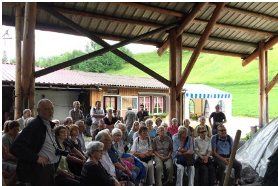
Vor einem Köhlermeiler an der Museumsfahrt