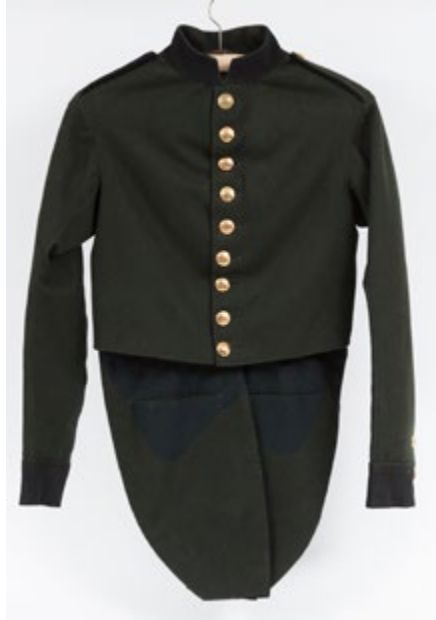
Uniform-Jacke der Luzerner Truppen (Schütze), 1820-1840, HMLU 13751.