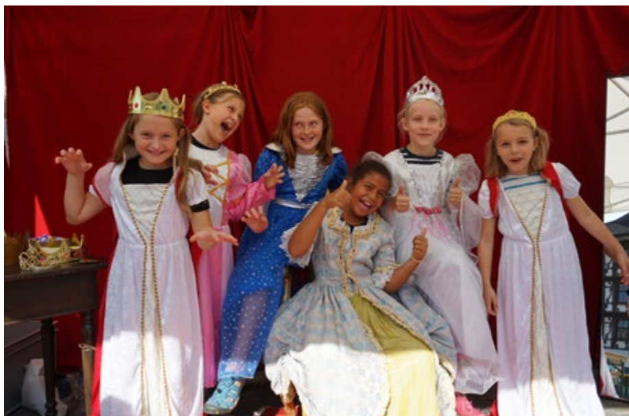
Zwei der vielen Angebote: Verabschiedung der «Queen Victoria» am Erlebnistag, verkleidete Prinzessinnen.