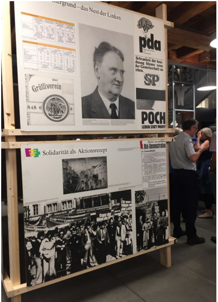
«Cabinet»: Re-Inszenierung der Ausstellung «Heraus aus Dreck, Larm und Gestank»