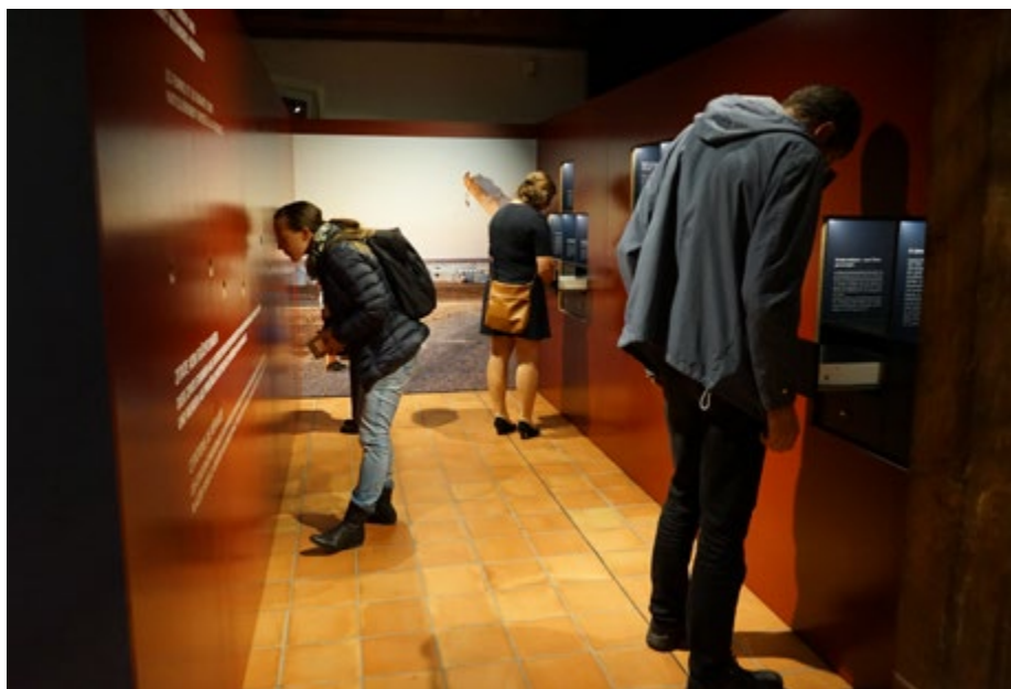
Impressionen aus der Ausstellung «FLUCHT».