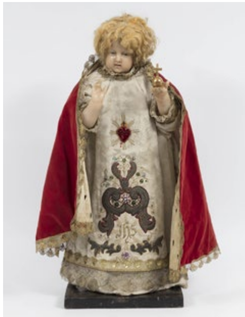
Prager Jesuskind (Nachbildung), Holz, Wachs, Stoff, 1750-1850, SZ 01903.