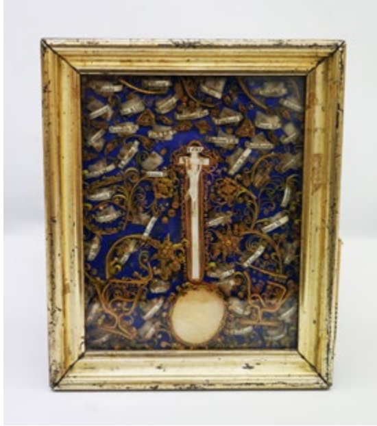
Glaskasten Agnus Dei mit Kruzifix, 1880-1900, SZ 01897.

ter Hersteller, um 1900, Geschenk (SZ 01896).