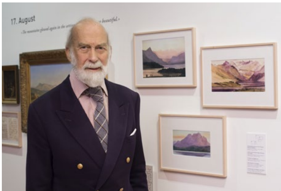
Oben: Aquarellieren wie Queen Victoria ; unten: HRH Prince Michael of Kent